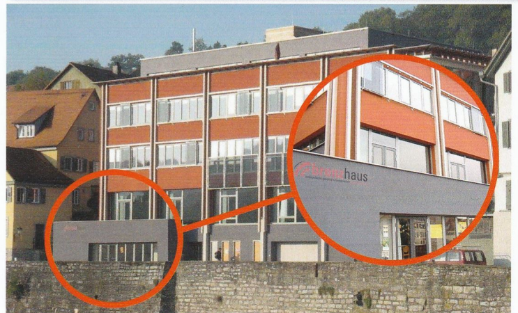
Jugendraum im Brenzhaus

Jeden Montag 19.30- 21.00 Uhr (14-tägig mit Angehörigen)